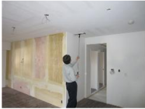
Fig.1 Construction states photograph of a chemical sorbent coating.